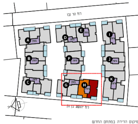
מיקום הרירה במתחם החדש